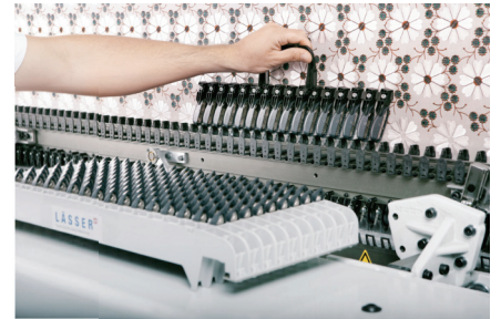
The shuttle transport module is filled with loaded shuttles. Die Schiffli transportkiste wird mit vollen Schiffli bestückt.