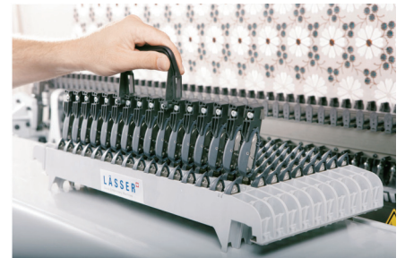
Empty run shuttles are placed into the free cartridge with the shuttle lifting tool. Leergelaufene Schiffli werden mit dem Schiffli Austauschsystem in die freie Füllleiste gehoben.