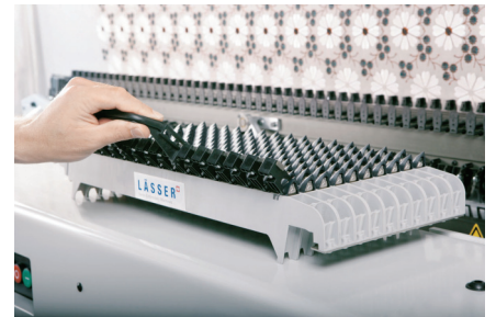
These steps are repeated until the machine is loaded. Die Vorgänge wiederholen sich bis die Maschine bestückt ist.